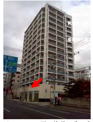
ワコー 石前ガーデンズ