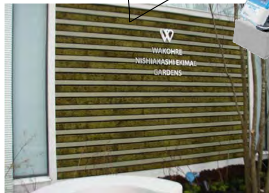
ワコーレ西明石駅前ガーデンズ モスライン・モスフラット仕様