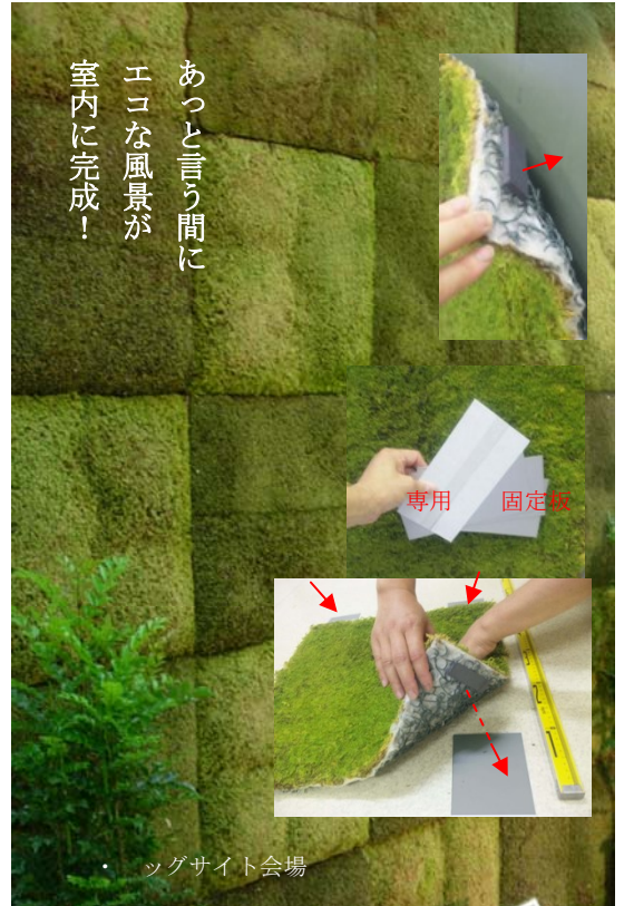
モスフェース 部材 専用固定板

[その他] HPまでお問合せ下さい。 http://www.moss-net.jp http://www.moss-net.jp/html/consult.html